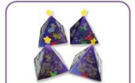
사계절/생일 별자리 조명등