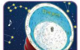
오르골 아랑 별자리판