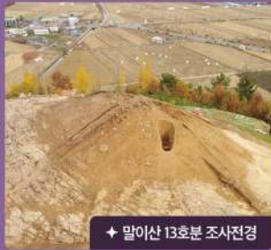
말이산 13호분 조사전경

말이산 고분군에서 가장 높은 곳에 위치한 말이산 13호분은 그 위치와 거대한 규모로 인해 오래 전부터 말이산 고분군에서 가장 중심이 되는 고분으로 여겨져 왔습니다. 일제강점기이던 1918년, 일본인 학자에 의해 부분적으로 내부가 조사되었으나, 그 결과가 보고 되지 않아 고분의 규모와 성격 등을 파악할 수 없었습니다.