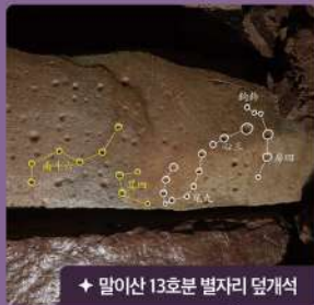
말이산 13호분 별자리 덮개석

190여개의 별 중 현재까지 확인된 별자리는 서양의 전갈자리와 궁수자리를 이루는 구성원으로, 동양에서는 각각 청룡별자리와 남두육성으로 불렸습니다. 특히 남두육성은 동양에서 인간의 수명과 운명을 관리하는 신성한 별자리로 여겨져, 앞으로 밝혀질 나머지 별자리와 연계한 연구가 진행된다면 당시 사람들의 천문관측기술과 항해술, 사후 세계관을 파악할 수 있을 것으로 기대됩니다.