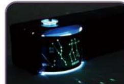
회전 별자리 빛상자