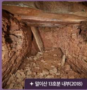
말이산 13호분 내부(2018)

2018년, 한국인 학자들에 의해 100년 만에 다시 이루어진 발굴조사 결과, 말이산 13호분에서는 무덤방의 천장 덮개석에서 고대 동양의 별자리를 비롯한 1900개의 별 흠으로 이루어진 은하수가 확인되었습니다. 동시대 한반도 남부에 조성된 무덤 내부에서 별자리가 발견된 것은 최초의 사례로, 말이산 13호분의 별자리는 고대인의 천문학에 대한 이해 수준을 파악하는 데 중요한 자료가 됩니다.